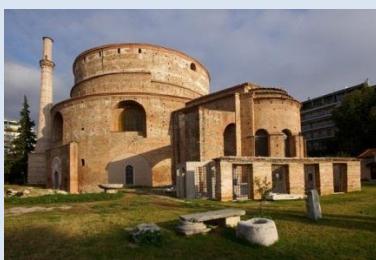
Црква Св. Ђорђа