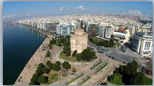
Бела кула је оригинално изграђена као део градских зидина

Град се налази на врху Солунског залива, дуж којег се пружа дужином од 20 km, у подручју измењене средоземне климе, захваљујући отворености града и околине утицајима из унутрашњости Балкана. Западно од града пружа се тзв. Солунско поље, приморска равница близу ушћа Вардара у залив (17 km западно од града). Са других страна град је окружен брдима планине Хортиатис.