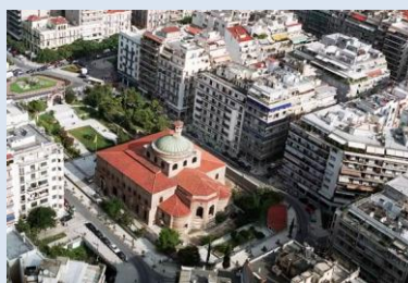
Црква Св. Софије