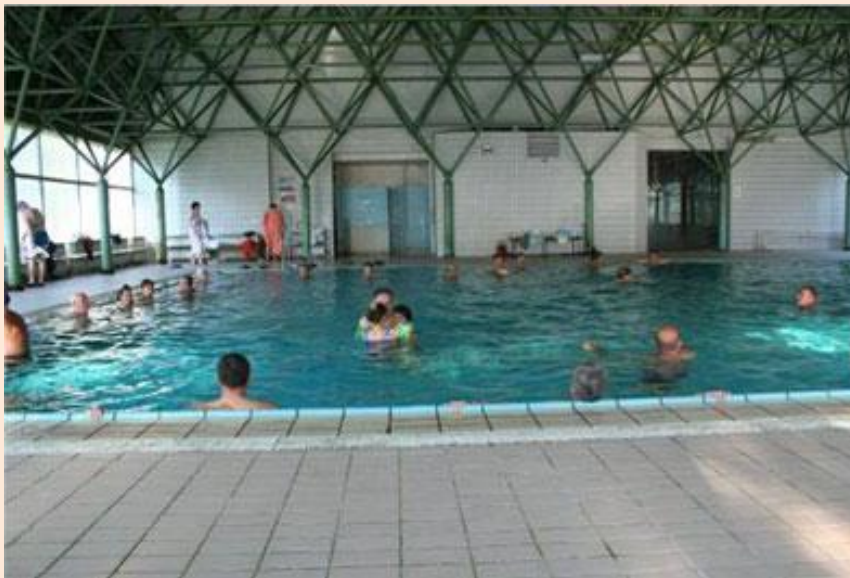
базен у хотелу „Вилина влас“

Љековита својства воде потичу од термичких, хемијских и механичких ефеката, те минерала које садржи. Врло је значајан лако испарљиви племенити гас радон који у организам доспијева путем коже и респираторног система. Доказано је да радон успорава процесе старења, смањује бол, подиже општу отпорност организма и повољно дјелује на неке кожне, ендокрине, респираторне и алергијске болести. Примјењује се за лијечење реуматских, неуролошких, ортопедских, гинеколошких, геријатријских и обољења дисајних путева, као и за посттрауматска и постоперативна стања. Такође се често користи у превентивне сврхе. Овде су долазили и