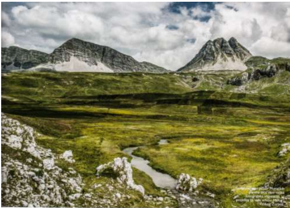
Planinski putovi kroz planinske masive, iznad planine u selu, u blizini Mrtvice, u blizini Zlatibora.