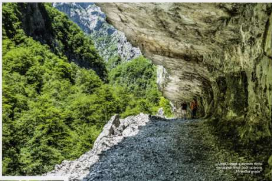
Uvek čimpa s gornjem vrhu vrstama koje još nismo prešli svojom Morača reka