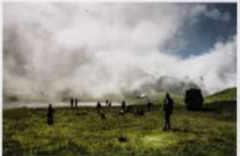
Konopceva potoka Kapetanovog jezera jedinstven je događaj. Pod kapom nebeskog stropnja se magla zadržava i oči i maglica koji koji jutarnje sunce.