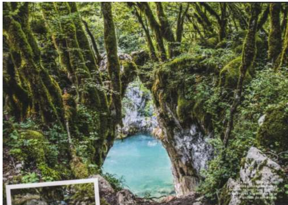
Uvek čimpa s gornjem vrhu vrstama koje još nismo prešli svojom Morača reka

Na Kapetanovom jezeru postoji nekoliko kuća u kojima borave ljudi koji se bave stočarstvom i koje nisu prilagođene primanju bilo kakvih gostiju. Međutim, ove godine je napravljena jedina kuća koja je vlasnik namenio izdavanju, ali je vrlo skromno opremljena. Naime ona se sastoji od same jedne prostorije u kojoj se nalazi dvanaest kreveta i nema ni vode ni sanitarnog čvora. Dakle, može vas zaštititi od nevremena i omogućiti vam udobnije spavanje od fatoca. U njenoj blizini je vlasnik, Dvojan Minić, sagradio još jednu, u kojoj je otvo-