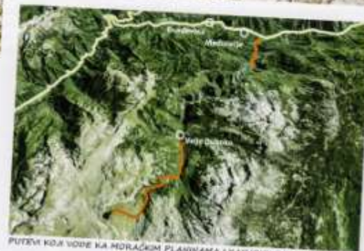
PUTEVK KOLJ VODJE KA MORAČKIM PLANINAMA I KANJONU REKE MRTVICE

Ovde nema električne energije i uslovnosti koje su čoveku postale dostupne zahvaljujući nos. Posetioci, uglavnom planinari, spavači u šatorima, heane se „u rancu“ (drugim rečima onim što su poneli od kuće), inada su oholi katuni puni napačnijeg, napakmanijeg, najštrpanijeg sita zvanog „kripanac“ (koji izgleda kao daleki rošak: one uglavljene okrugle i bučaste lepičice zvane monarvili). Domaće pogibe i same pite od ručno razvijenog testa kulinarški su repertoar kući, na sreću, nije nestao. Kada čujete za ovo mesto i vidite fotografije rečnih odvajanja i organizovanih ljudi, obično kažete sebi „teško je“, i kada vam ratum kaže da razmislite, moj savet je da poslušate svoje srce.