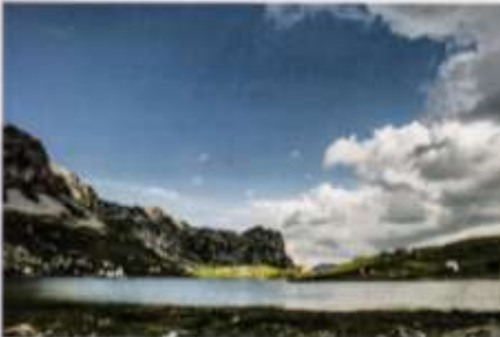
Konopceva potoka Kapetanovog jezera jedinstven je događaj. Pod kapom nebeskog stropnja se magla zadržava i oči i maglica koji koji jutarnje sunce.

Ovo je bio plan puta koji smo prošli zbirajući klobuk KALPI kod organizacije www.srbijaindoor.com. Ako želite saznati više o planinskim putovima i mogućim planovima bi u Nikitiću putuju koji je opisan, do Kapetanovog jezera, a zatim u Velje Duboko raskodamašim putom, bušaći je i čiji su starišni i ovi saša ozari i onuda putujuć automobilu. Ako imate saznanja koji nije zainteresovani da prođe na putu, imate kola da prevare od Velje Dubokog preko Crnovice, i jedrja i Moraču do magistrale za Beograd, do mesta gde se Mrtvica uliva u reku Moraču. Tu voi saznanja u magistrali na kolonici, a može u međuvremenu do obale moravice. Moravica je se od ove osenice nalazi na pet kilometara prema Kolatini. U zavrtanju od reke moravice, stičući ovog pravca mogu je i obrnutu putuju iz Beograda ka Kolatini preko moravice Morača, nakon pet kilometara tača s razmeru Medunice koje vam da skenete desno na koloni put, koji vam vodi u Velje Duboko.