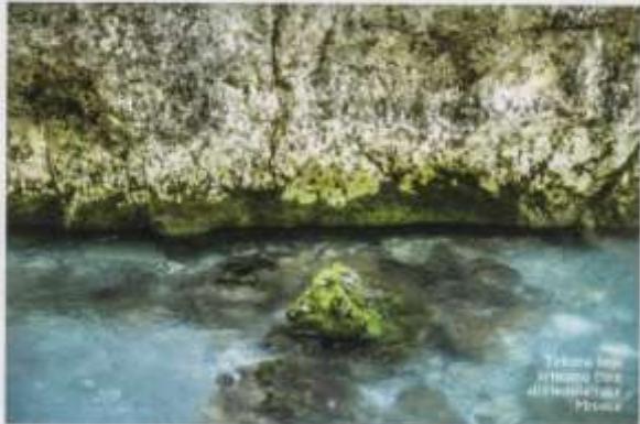
Uvek čimpa s gornjem vrhu vrstama koje još nismo prešli svojom Morača reka

Kad god govorim o prirodi, za mene granice ne postoje. Priroda je univerzalna, upita, svečija i ni- čija, ona se ne može deliti i razvlačiti na svoje ili tvoje deo, na svoju ili tvoju drjavu. Nijma jedina oteavajuda plovitost je udaljenost i najčistije s tim poveznani materijalna nemogućnost da je do- segnemo. Za sada, ovaj deo je najčistiji od ljudske zbilosti da joj nauči i da sve ono što nam se ne su- pristvati zagadilino i obesmišlino. Da li će se neko setiti da postroje načini da ove kaktiv nemovnih prizora zaštitimo od nas ljudi, ostaje da se vidi... ali vi ipak poburite. »