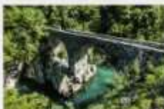
VAHNI MOST NAŠKA BAŠKA (R. 2015)