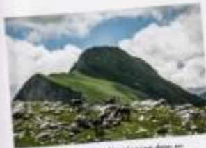
ŠVALJA LEPOTA – Mrtvica planina delo je kanjona koji zadržava prazno i opčinu uvek.

Kolina u kojoj se amestilo selo Velje Duboko je kao čiri deo ševca i kako polako ulazite u kanjon, imate osećaj da vas prosto unisara neverovatnom snagom i tako hipnotisari vide ma se ne možete suprotstaviti. Nakon pola sata hoda staza se gubi, i shvatate da morate preći na levu obalu reke Mrtvice.