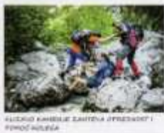
KULČIĆI KAMENJE ZAHTEVA IZVRSNOST I POMOĆ NALAZA