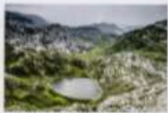
POGLED NA JEZERO MARIVO