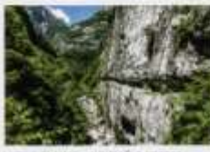
USEK U PLANINI - "MRTVAŠKI GREDE"

u potnu jesen, kada nivo vode opadne, uspeva da ugleda sunce) i uguše se na njemu. Ponašanjem nekih već videlih prizora i stvaranjem novih, i dalje čudesnih (ogromni kameni oblici svjenu u vlažnu mahovinu), udaljavala se od našeg pogleda sve dok je nisu sakrile trave i oštre ivice kanjona.