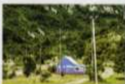
PRODAVAC I KAFEJE U RETE ALI LAMP UČE, VE

Štazet s njom na ovom mestu izaziva i divljenje i opevnost, jer ona istovrua između ognosnih stena koje je ko zna kada dovela na ovo mesto. Pruze je istovremeno i magičan, jer je stvorila nekoliko vodopada, da li se potom se zaglušujući huk malo smirila u bućim i emargidnešenim kadama, kao da skuplja snagu jer dug je put do njenog ulaza u Moraču. Reka Mrtvica na tom putu deli da usubri i fascina, što joj nekako uspeva.