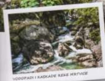
VOĐOPADI I KASKADE REKE MERTVICE